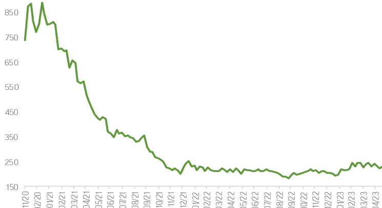
Первичные заявки на пособие по безработице, тыс.