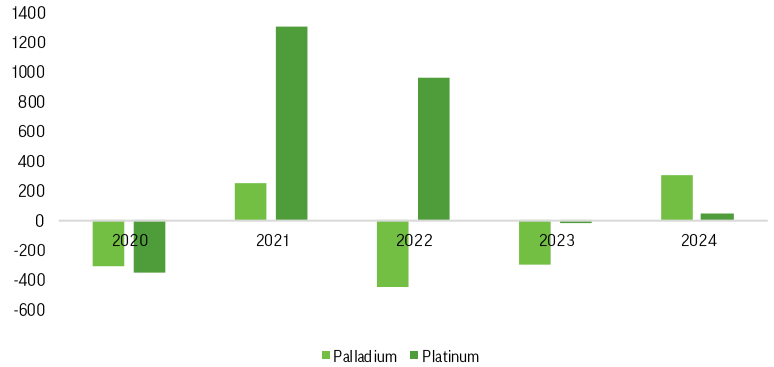
PGM market balance (Nor Nickel estimates)