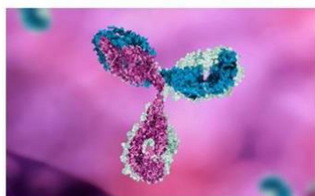
Monoclonal antibodies (mAbs)