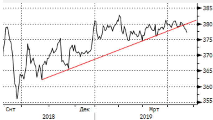
USDKZT: попытка пробоя трендовой линии