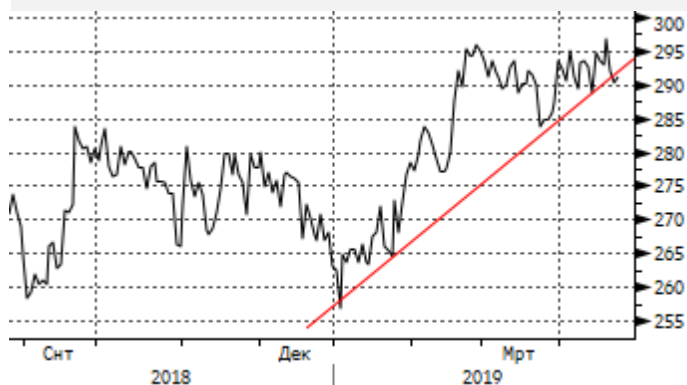
Медь: сопротивление на 296