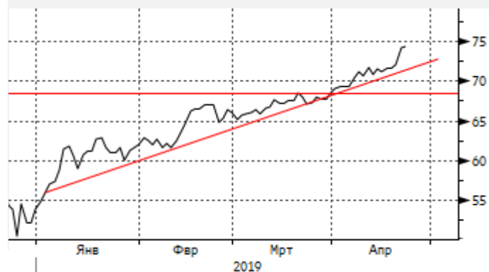
Нефть: движение по трендовой линии