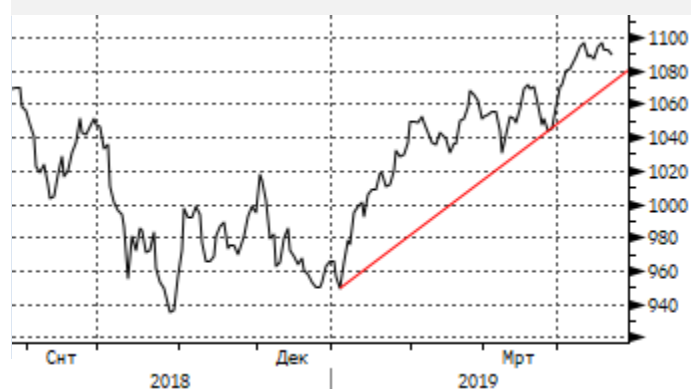
EM: отскок вниз от 1100